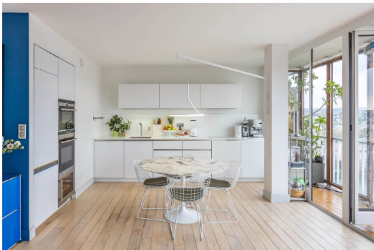
L'espace salle à manger est baigné de lumière toute la journée grâce aux baies vitrées.