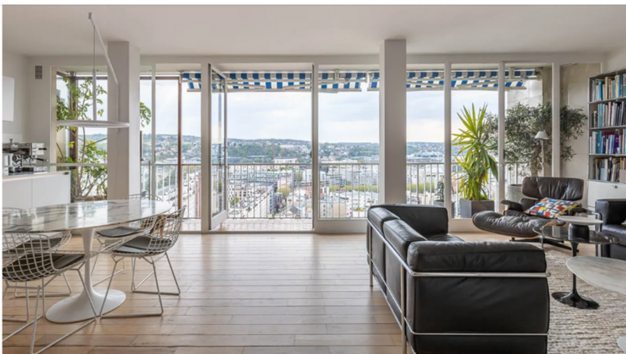
L'appartement, dans cet ensemble culte de Fernand Pouillon, offre une vue panoramique.