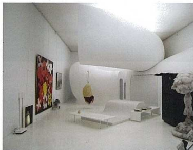
Vue de l'Atelier d'artiste

A l'issue d'un concours organisé par l'EPA Plaine de France, l'agence « Güller & Güller » a été désignée pour réaménager le Triangle de Gonesse. Situé entre les deux pôles économiques du Bourget et de Paris Charles de Gaulle, cet espace d'une taille de 1000 hectares représente un fort potentiel pour le développement de la Plaine de France.