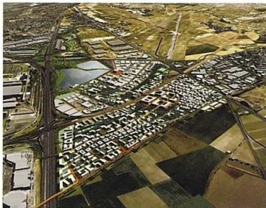
Plan aérien