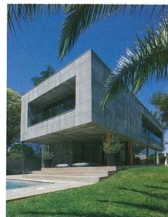
Louis Paillard, maison trapèze, Montreuil